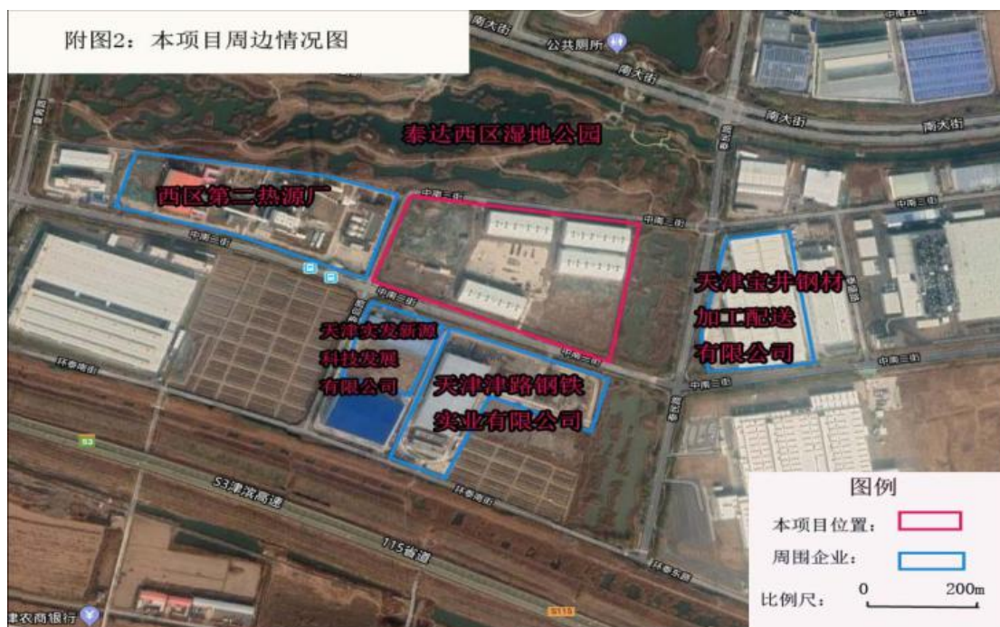
附图 2 区域位置图