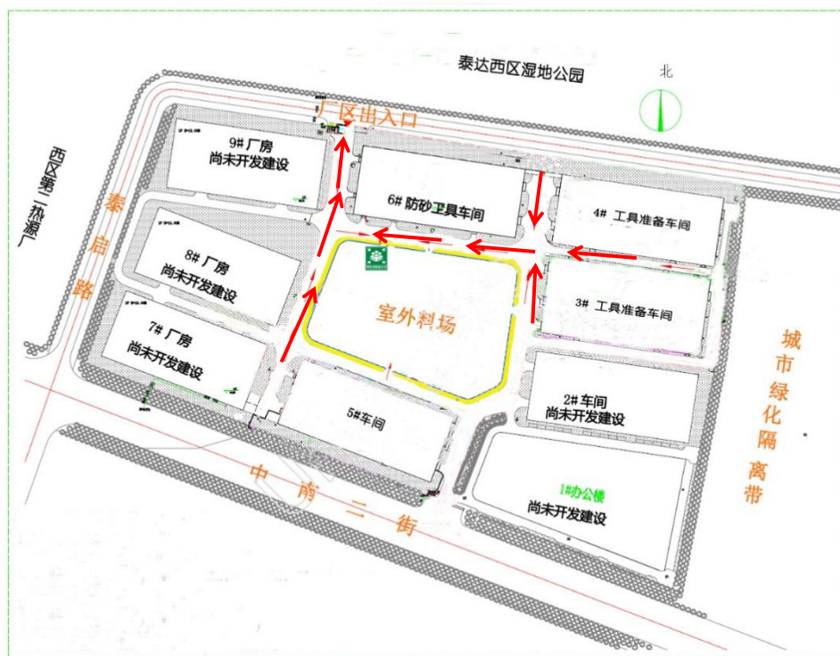
附图 5 应急疏散图