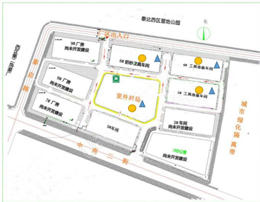
附图 4 公司风险单元与应急物资分布图