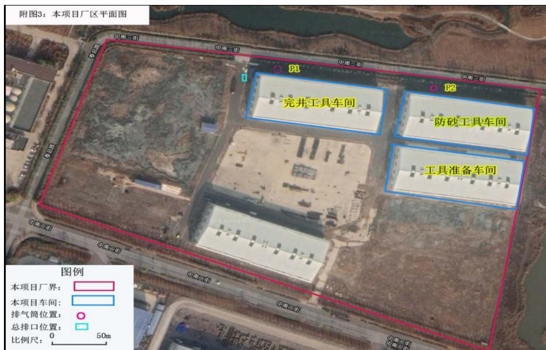
附图 3 厂区平面图